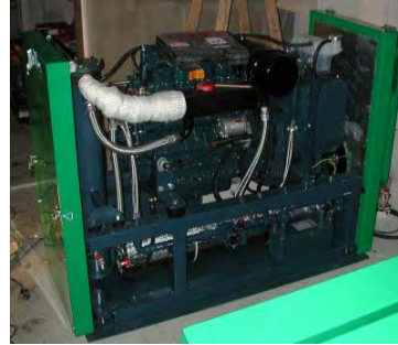
Abbildung 1 (Links) Das „Schiestlhaus“ am Hochschwab mit 100%iger regenerativen Energieversorgung und Passivhausqualität; Abbildung 2 (Rechts) installiertes Rapsöl Mikro-BHKW von KW Energietechnik

Die Heizungs- und Warmwasserversorgung des Gebäudes wird durch die fassadenintegrierten solarthermischen Kollektoren (62,5 m 2 ) und einem Lohberger Festbrennstoffherd (Holz) mit einer Nennheizleistung von 14 [kW] gewährleistet. 60% des elektrischen Energiebedarfs sollen über das Photovoltaiksystem mit einer Kollektorfläche von 52,3 [m 2 ] und einer Spitzenleistung von 7,5 [kW p ] gedeckt werden. Das modulierende Rapsöl-Mikro-BHKW (max. elektrischer Output 14 kW / max. thermischer Output 27 kW) wurde zur Deckung des übrigen Strombedarfs und als Backupsystem installiert.